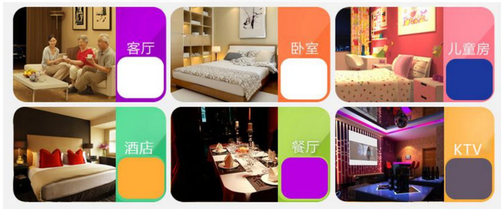
图一 产品适用场景示意图

广泛适用于家居卧室、酒店客房、西餐厅、KTV、舞台等 需要对灯光进行明暗调节以及色温冷暖调节的场所。