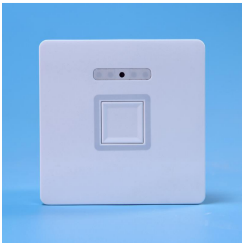
图二 产品正面结构图