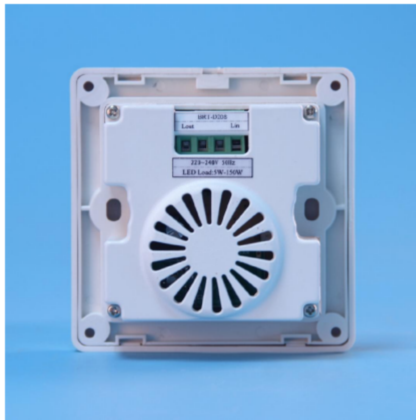
图三 产品背面结构图