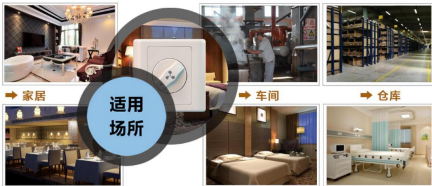
图一 产品适用场景示意图

该系列电子调速开关可对电风扇、炉具风机、管道排风机、电器、冷却风机等设备进行速度的调节和控制，可广泛应用于家居、宾馆、别墅、咖啡厅、酒吧、医院及家庭等各种场所。另外，还适宜流量变化较大的泵和风机类负载作调速之用， 可获得良好的预期效果。