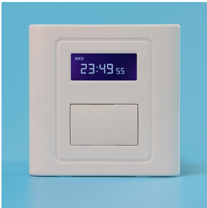
图二 产品正面结构图