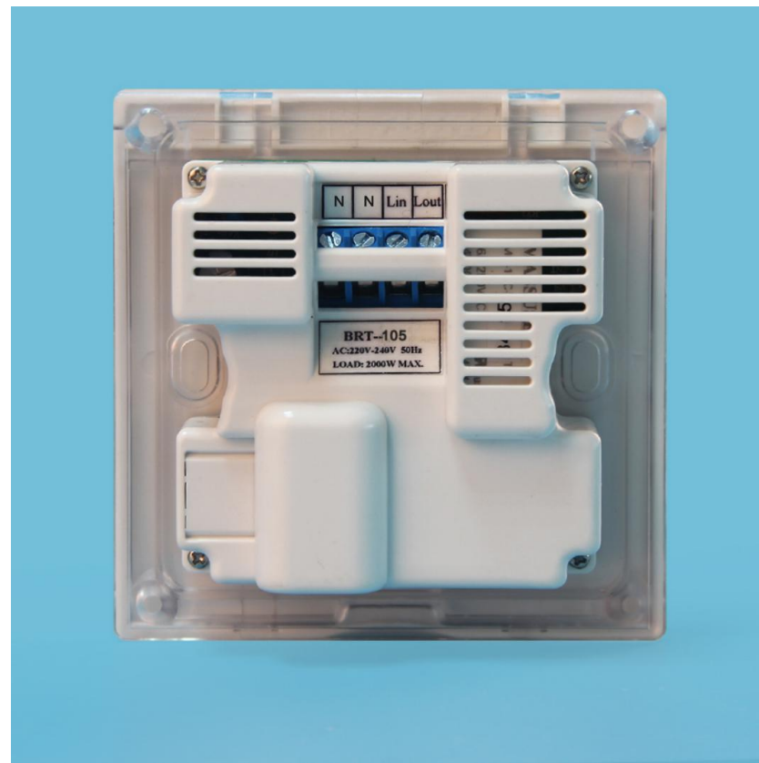
图三 产品背面结构图