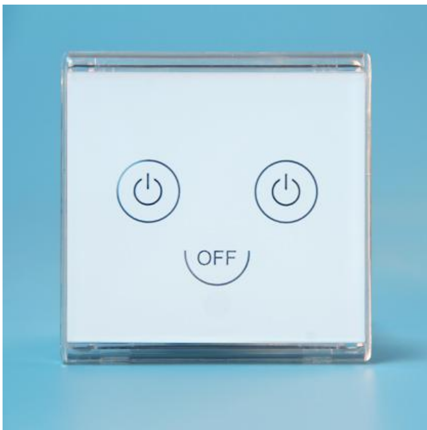
图二 产品正面结构