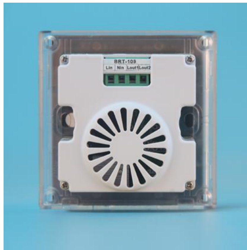
图三 产品背面结构