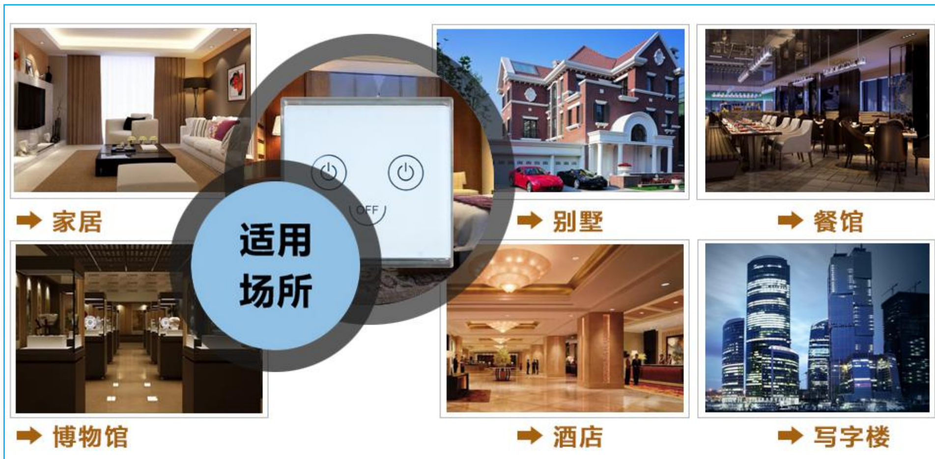
图一 产品适用场景示意图